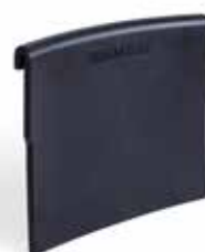
Rückenlehnenpolster PU Artikel-Nr.: Z-52848-16