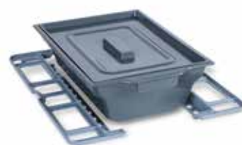
Toiletteneimer rechteckig Artikel-Nr.: Z-52848-19