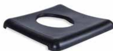
Sitzplatte PU mit Öffnung klein, Höhe: 15 mm Artikel-Nr.: Z-52848-15