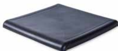
Sitzplatte PU geschlossen, Höhe: 16 mm Artikel-Nr.: Z-52848-12