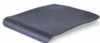
Sitzplatte aus Gummi geschlossen Artikel-Nr.: Z-52848-11

Das kann sonst keiner: Mit seiner Faltbarkeit lässt Juno die Konkurrenz weit hinter sich und wird zum idealen Begleiter – ganz gleich, wohin es geht!