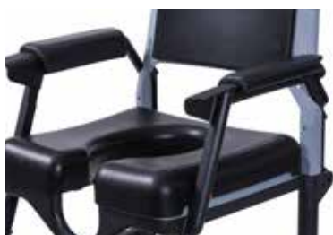
Sitzplatte PU mit Öffnung, Höhe: 50 mm Artikel-Nr.: Z-52848-14