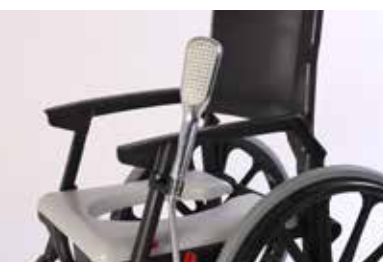
Halterung für Duschbrause Artikel-Nr.: Z-52848-18