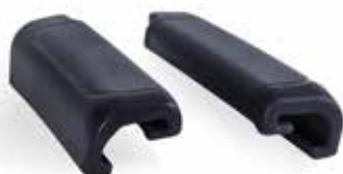
Armlehnenpolster-Set PU Artikel-Nr.: Z-52848-17