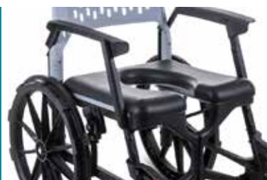
Sitzplatte PU mit Öffnung, Höhe: 16 mm Artikel-Nr.: Z-52848-13